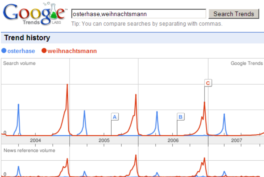
Abbildung 3.1: Screenshot von Google Trends (Osterhase,Weihnachtsmann)

auf Keywords mit einem größeren Suchvolumen begrenzt und somit nur bedingt einsetzbar.